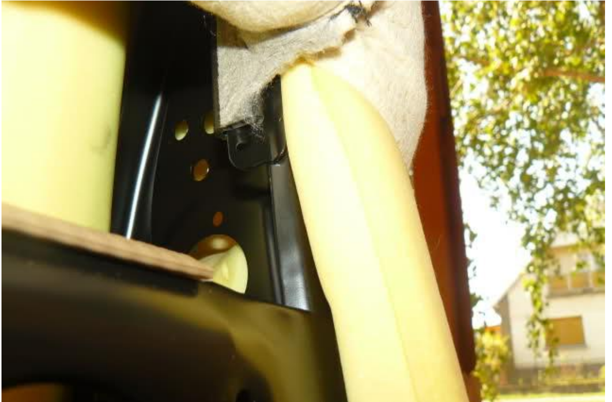
6. Deréktámasz mechanika feltárult: